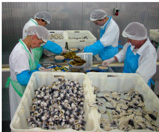
Figur 1: Foredling av sild i Polen

Prosjektet ble satt i gang som følge av betydelige utfordringer for foredlingsindustrien i Norge og et behov for å tenke nytt. Tyskland og Polen er viktige markeder for norsk sild og det er særlig edikkmarinerte og saltede sildeprodukter som etterspørres her. Ustabile priser de siste årene, har gjort at det har vært behov for å tenke nytt i forhold til disse viktige markedene.