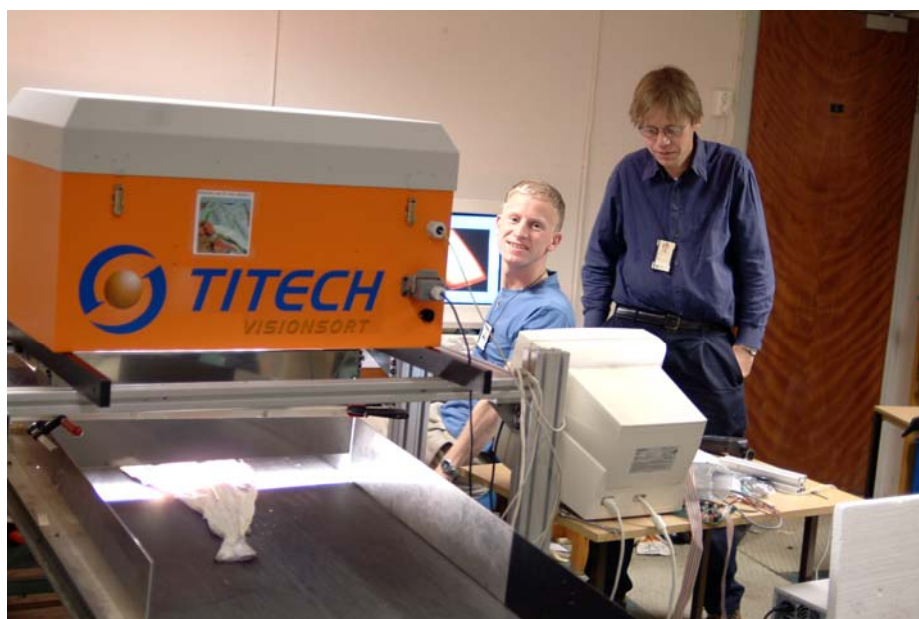
Figur 2 Innledende undersøkelser med NIR skanneren ved SINTEF IKT.

Per i dag er det Titec Visionsort som er den mest sannsynlige kommersialiseringsaktøren siden systemet er basert på deres produkt. Bedriften har nå søkt patent på systemet. Rent teknisk bør systemet oppgraderes med en ny detektor som er noe bedre egnet for det spektrale området vi ønsker å måle i. Det vil også være nødvendig å lage en helautoamtisk rutine som ekstraherer og prosesserer den nødvendige informasjonen fra de spektrale bildene som genereres.