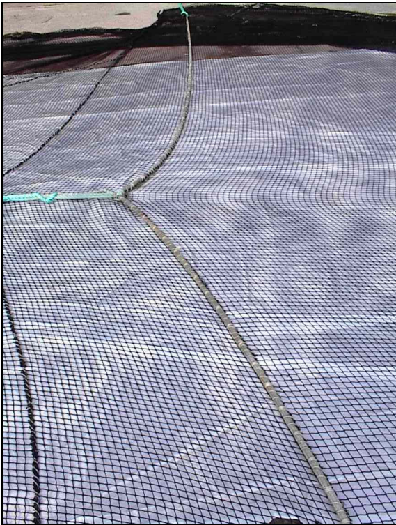
Bilde 1 Sidetau (lysegrønt) som trekkes oppover mot hovedtau.