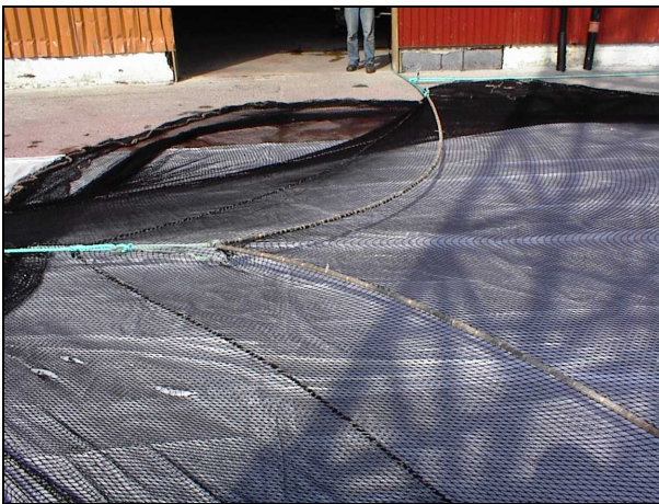
Bilde 2 Sidetauet trekkes opp, og vi ser at notlinet i bunnen strammes.