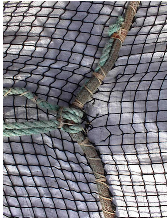
Bilde 3 Vi ser at maskene i notlinet begynner å sprekke grunnet påstanden fra sidetau