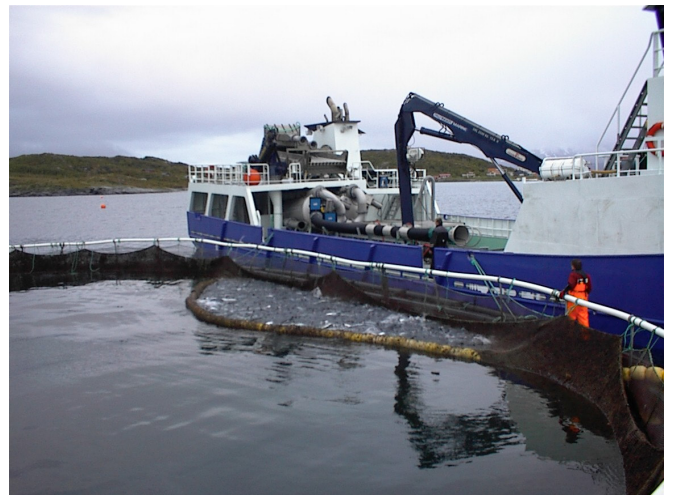
Bilde 4 Når kulelina er kommet over danner det seg lett folder i notlinet. Lin derfor med forsiktighet.