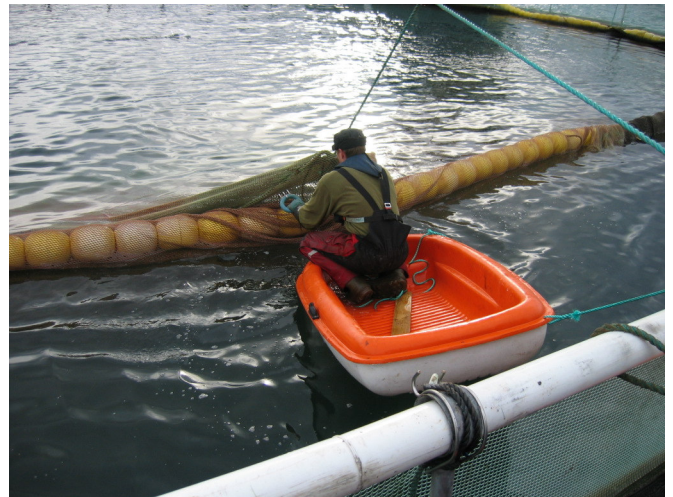
Bilde 3 Sørg for at det ikke danner seg lommer i notlinet som laksen kan gå fast i.