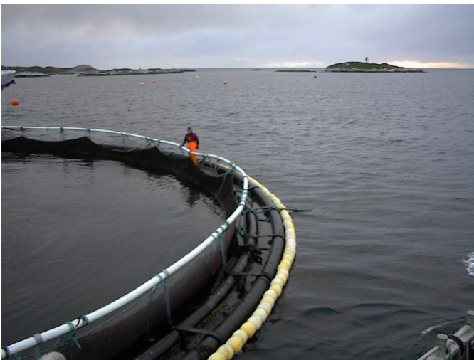
Bilde 2 Kulelina er trukket på utsida av flytekragen.