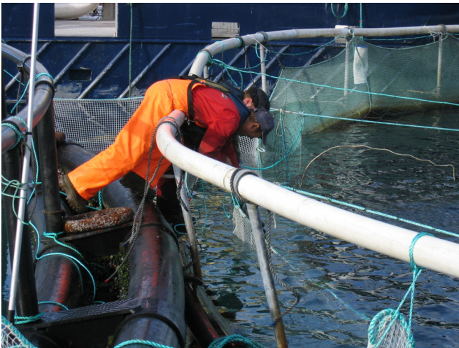
Bilde 1 For å minimere avstanden mellom nøtene er den ene flytekragen trukket oppå den andre.