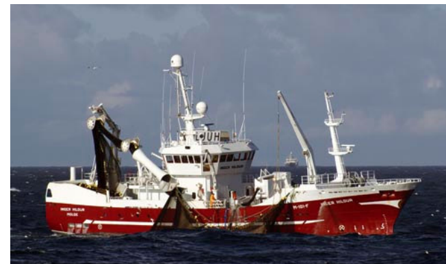
Inger Hildur er en av medlemsbåtene i Energinetverk Fiskeflåte

Norges Fiskarlag og Fiskeri- & Havbruksnæringens Forskningsfond