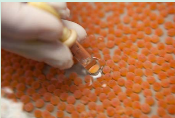
Høsten 2010 kan SalmoBreed levere rogn som er skreddersydd for økt motstandsevne mot PD og lakselus.