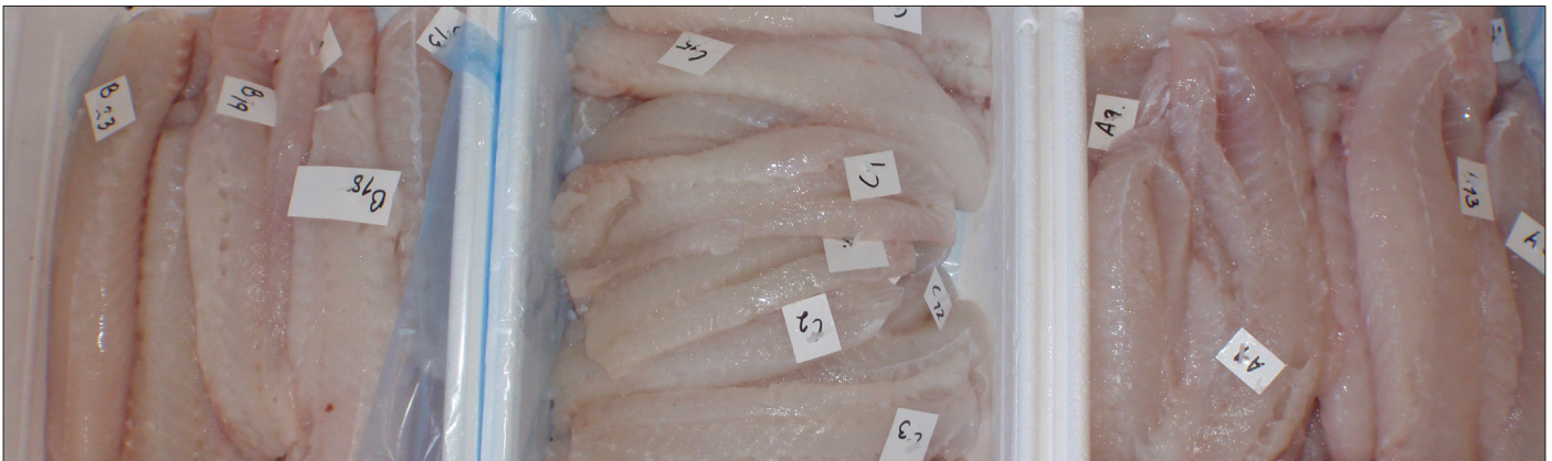
Tilfeldig valgte loins fra prøvepartiene, i filethallen i Båtsfjord. Loins i bakken til venstre (merket B) kommer fra parti 2 (direktesløyd og RSW-kjølt). Loins i bakken i midten (C), kommer fra parti 1 (bløgget og iset), mens loins i bakken til høyre (A) kommer fra parti 3 (direkte sløyd, RSW-kjølt og pumpet).