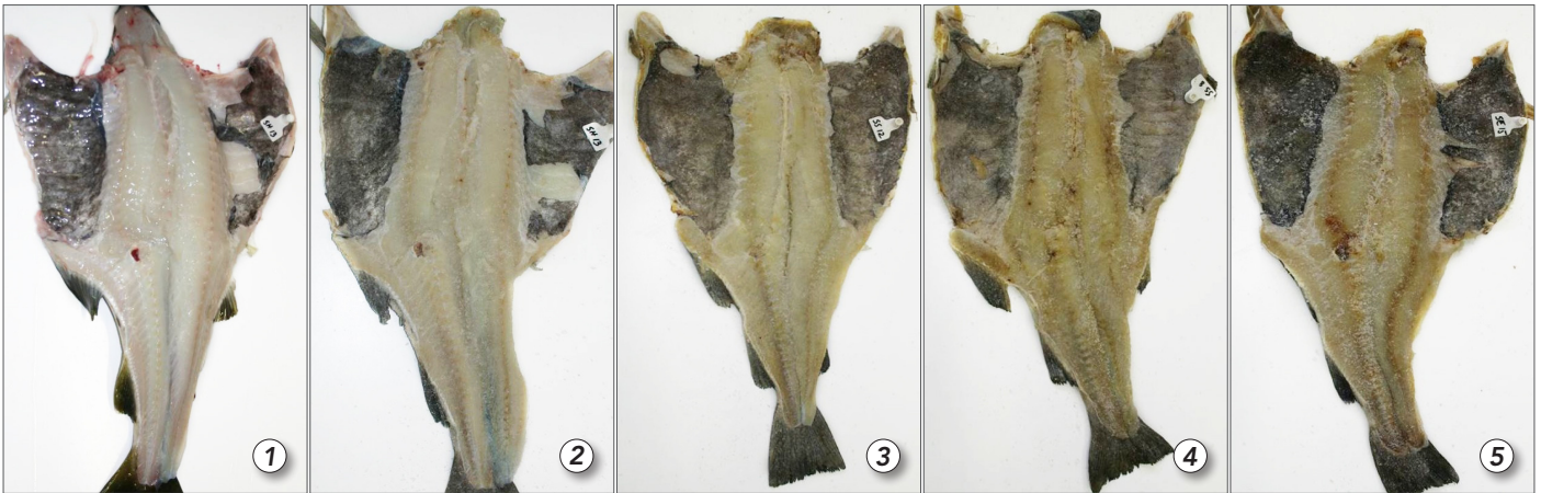
Bilde 1 viser perfekt råstoff som i bilde 2 har blitt til en perfekt saltfisk. Bildene 3, 4 og 5 viser ferdig saltfisk med økende grad av blodflekker som skyldes dårlig blodtapping.