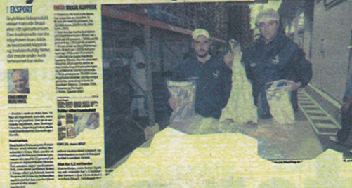
Fiskeribladet Fiskaren 19. september 2012

markedets krav til maskinen. Maskinen tar mindre plass enn den som er kjent til nå. Hver fisk merkes modulbasert med merkelapper. Målet er å installere prototype i september eller oktober.