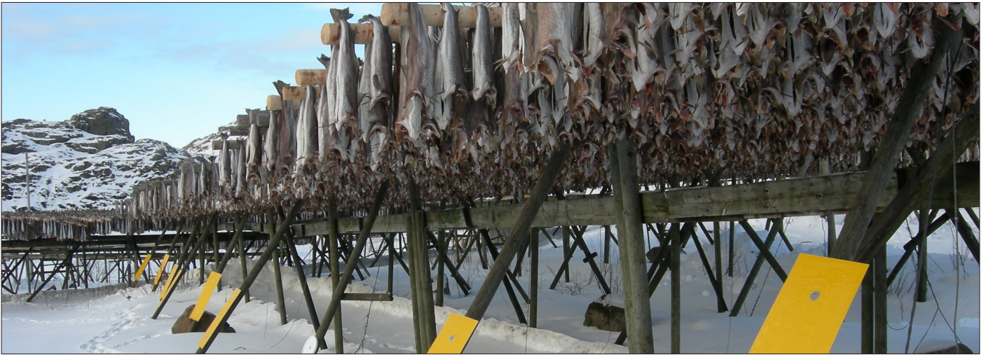
Fluefangst i Lofoten: I 2010-prosjektet ble antallet gule limfeller doblet sammenlignet med tidligere år.