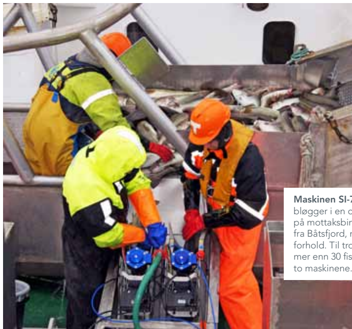
Maskinen SI-7 Combo som avliver og bløgger i en operasjon ble plassert direkte på mottaksbingen ombord på M/S Kildin fra Båtsfjord, noe som ga dårlige arbeidsforhold. Til tross for dette ble det bløgget mer enn 30 fisk per minutt, på hver av de to maskinene.

Det er slag- og bløggemaskinen SI-7 Combo til australske Seafood Innovations som nå utprøves i den norske havfiskeflåten. Maskinen som avliver og bløgger i en operasjon har i lang tid vært benyttet ved norske lakselakterier. Det spesielle ved disse maskinene er at de kan håndtere fisk fra to til åtte kilos størrelse, uten justering.