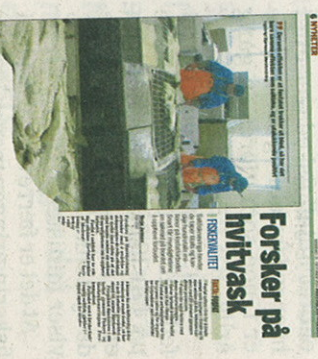
Forsker på hvittrask