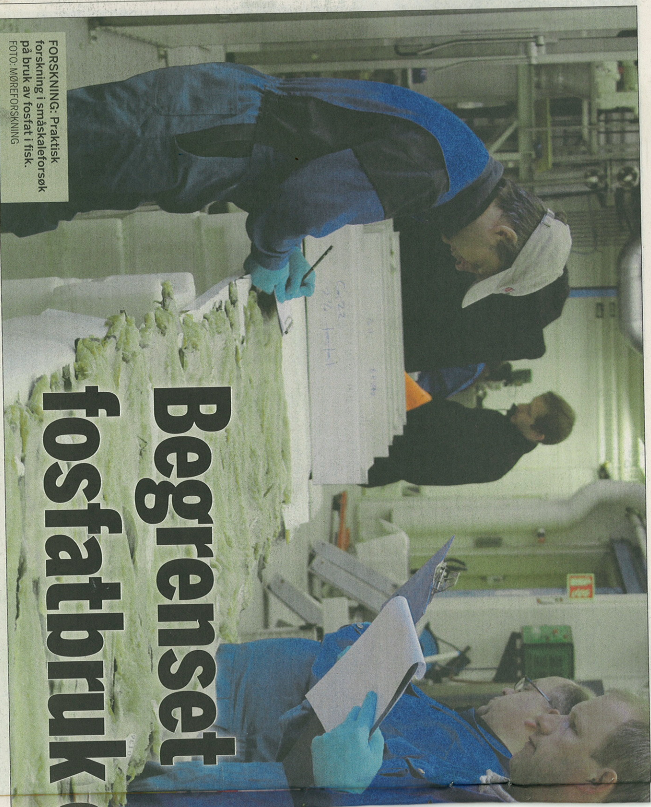
FORSKNING: Praktisk forskning i småskaleforsøk på bruk av fosfat i fisk.