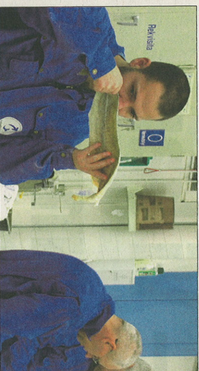
FOSFATFORSKNING: Møreforskning Marin dokumenterer fosfats virkning som hjelpstoff eller tilleggstoff i fisk.