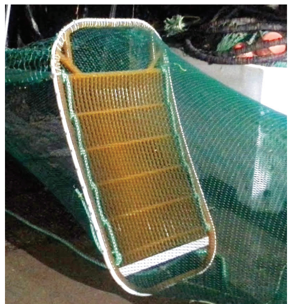
Figur 1: Krepsehullet i nedkant av rekerista.

Forsøkene ble utført ombord på rekefølgeren "Camo" i området sør og øst for Færder fyr. Totalt ble det gjort 18 hal, fordelt på tre tokt i hhv mars, april og november. Fartøyet fisket med to identiske, kommersielle tråler rigget som dobbeltrål. I begge trålene var det montert inn