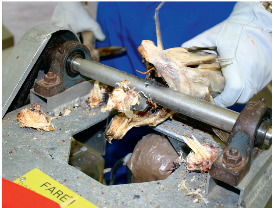
En «nakkekutter» benyttes til åpning av nakken på tørrfisken. De fremste nakkevirlene rives ut av tørrfisken og åpner for bedre ettertørking.

Åpning av nakken betyr at de fremste nakkevirlene rives ut av tørrfisken ved hjelp av en såkalt nakkekutter. Dermed blir fisken åpen inn langs ryggbeinet hvor fisken har tørket minst. De som gjennomfører tidlig åpning i nakken mener fisken kan tørke hurtigere og at de dermed kan få bedre kvalitet. Andre mener at tidlig åpning av nakken vil gi mer makk, samt at mer lys og luft på fiskemuskelen vil være ugunstig for fargen.