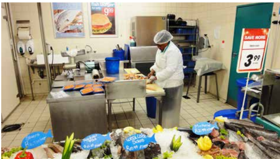
På grunn av at importørene også fungerer som grossister finnes det ikke mange rene grossister som selger uforedlet laks i Sør-Afrika. Grossistene er ofte små bedrifter som selger små volum av ubearbeidede eller bearbeidede produkter.