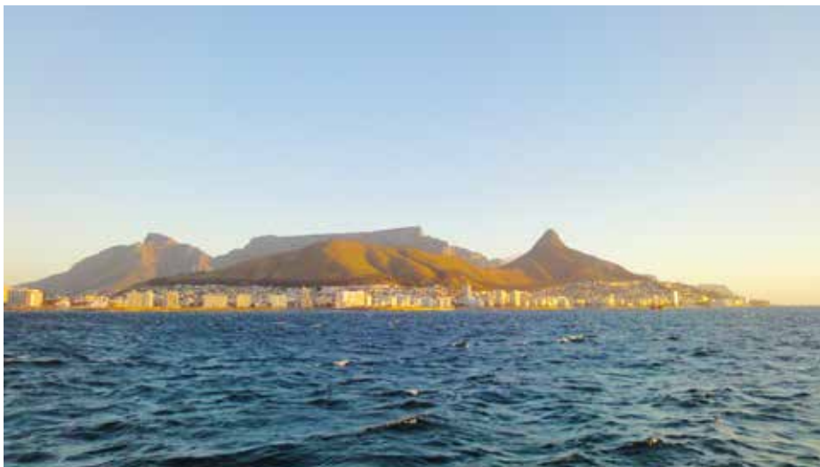
Sør-Afrika er et av områdene i verden med prosentvis raskest økonomisk vekst, og kunnskap om dette laksemarkedet er derfor av verdi for bedrifter som ønsker å satse i andre områder i denne regionen. Her er fra Cape Town – den lovgivende hovedstad i landet og den tredje største med ca 3 millioner innbyggere.