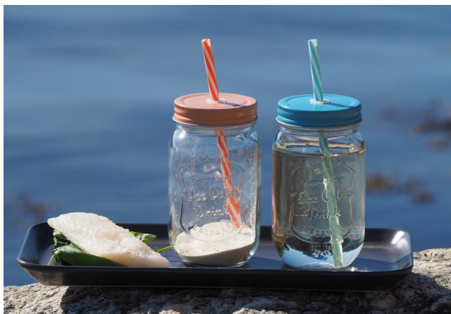
Bildet viser protein tilsvarende en filet i pulverform og løst i vann. Vannløselige protein øker markedsmulighetene.